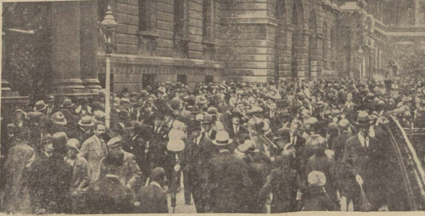
Buhran zamanlarında İngiliz halkı, Kral sarayında haberleri bekliyor.